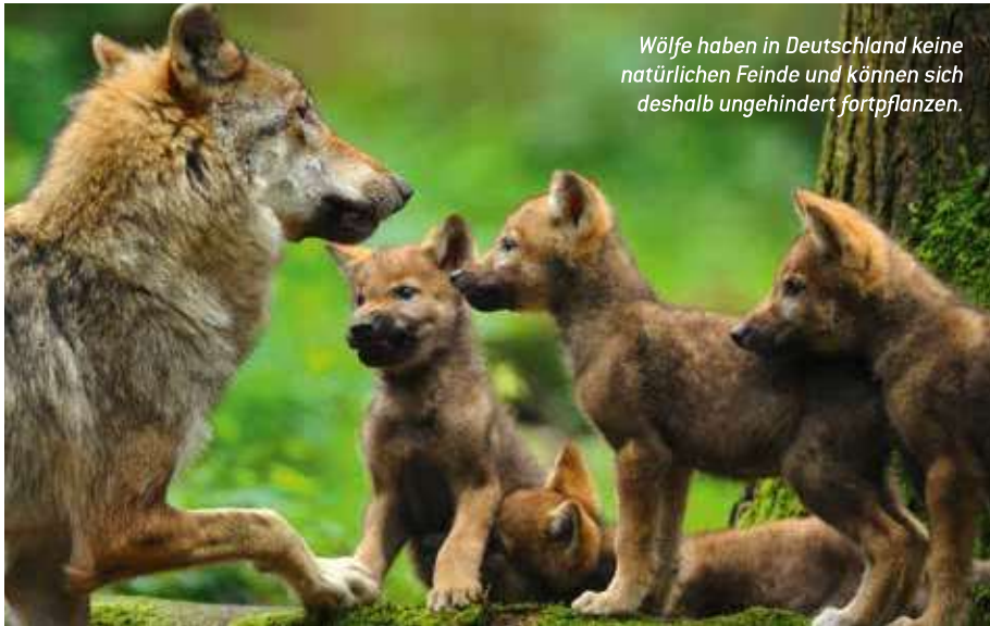
Wölfe haben in Deutschland keine natürlichen Feinde und können sich deshalb ungehindert fortpflanzen.

aktuellen Meldungen über Wolfsrisse geben uns allen Grund zur Sorge.“ Die FN steht in engem Schulterschluss mit anderen Interessenvertretungen wie dem Bauernverband und den zuständigen Ministerien.